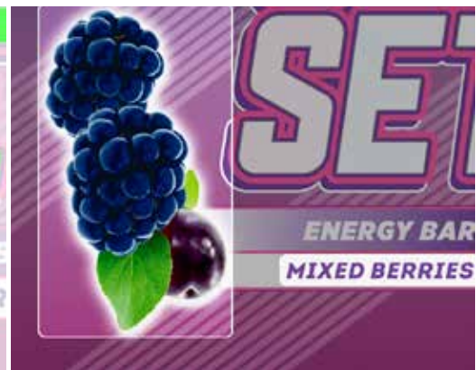
Контроль качества допечатной подготовки

Belgium Kortrijksesteenweg 1095, 9051 Gent | Tel. +32 9 216 92 11 | info.eur@esko.com USA 8535 Gander Creek Drive, Miamisburg, OH 45342 | Tel. +1 937 454 1721 | info.usa@esko.com Brasil Rua Professor Aprígio Gonzaga, 78, 10º andar - São Paulo, SP, 04303-000 | Tel. +55 11 5078 1311 | info.la@esko.com Singapore 8 Changi Business Park Ave 1, UE BizHub East #07-51, South Tower, 486018 | Tel. +65 6420 0399 | info.asp@esko.com Japan Telecom Center Building, West Wing 6F, 2-5-10, Aomi, Koto-ku, Tokyo, 135-0064 | Tel. +81 (3) 5579 6247 China Floor 6, Building 1, 518 Fuquan North Road, Changning District, Shanghai, P.R.C, Zip Code: 200335 | Tel. +86 21 3279 6555 | info.china@esko.com