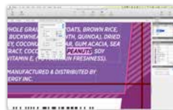
Текстовые поля распознаются автоматически и позволяют компоновать текст при вводе.