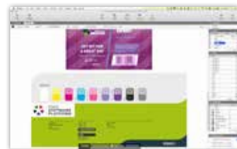
Модуль Dynamic Marks автоматически создает панели данных для заданий

ArtPro+ позволяет применять растривание на основе объектов для повышения качества печати. Эта функция доступна как для нормализованных, так и для новых входящих PDF-файлов. ArtPro+ предлагает расширенный набор инструментов на основе форм точек Imaging Engine, а также пользовательских форм точек. Уникальное представление растривания значительно упрощает проверку качества растривания.