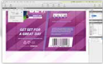
Иерархическая навигация показывает сведения о групповых объектах

ArtPro+ — это редактор PDF-файлов для допечатной подготовки упаковки. ArtPro+ позволяет работать с PDF-файлами напрямую и включает богатый набор функций редактирования для подготовки графики к печати.