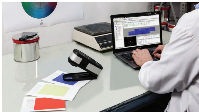
Статистический анализ производимых измерений

Color iQC Print предоставляет различные варианты вывода информации на экран, а также операции экспорта-импорта для пользователей, позволяя встраивать программу в уже имеющийся рабочий поток. Подобная возможность систем работы с цветом и распределения данных в течение времени и географически, становится очень важным фактором в постоянно изменяющейся среде спроса и предложения. Простой пользовательский программный интерфейс совместно с современным математическим аппаратом позволяет сконфигурировать программу для решения различных задач, начиная с «простого» сбора измерений до полнофункционального анализа данных.